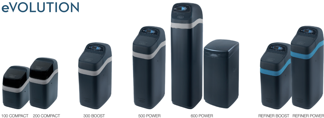
100 COMPACT 200 COMPACT